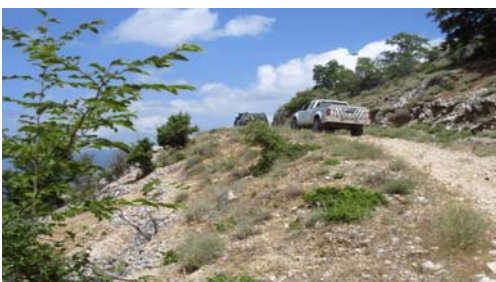
- Steinige Pisten auf der Insel Cres

3. Tag: Unsere SILVESTER-Ausfahrt! Insel-Offroad ist angesagt! Was wir gestern noch von Weitem gesehen haben. wollen wir heute 4 x 4 erkunden: Mit der Fähre erreichen wir die Insel Cres. Hier fahren wir auf sehr schönen offroad Strecken, teils durch dichte Wälder, teils hoch über dem Meer, erkunden mittelalterliche Dörfer und schiffen uns am späten Nachmittag wieder auf die Fähre Richtung Festland ein. Am Abend ist hoffentlich noch genügend Kondition für unsere Silvesterparty in unserem Hotel am Meer vorhanden!!!