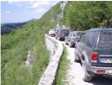
- Alpine Pisten im Učka-Gebirge – im Winter vielleicht auch mit Schnee

Istrien und die Insel Cres – mediterranes Klima, auch im Winter, mittelalterliche Dörfer im Hinterland und pittoreske Städtchen an den Küsten. Verbunden durch abenteuerliche offroad Strecken in immergrüner Landschaft, mal alpin – mal maritim. Ein 4 x 4 Silvester Urlaub, mit allem, was zum genießen dazugehört!