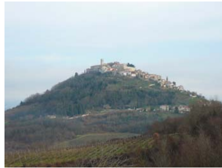
- Motovun – Unser Etappenziel ist der Gipfel

4. Tag: Nach einem späten Frühstück geht es wieder in die Berge. Wir überqueren auf dieser Etappe das Učka Gebirge auf unserem Weg ins Landesinnere. Weil wir schon in der Gegend sind, ist die Erkundung des versteckt gelegenen Wasserfalls von Sopot ein Muss! Nach einigen abenteuerlichen Teilstrecken sehen wir auf einer Bergspitze plötzlich unser Tagesziel: Die mittelalterliche Stadt Motovun! Hier übernachten wir wie einen Adlerhorst im ehemaligen Schloss auf dem höchsten Punkt des Berges.