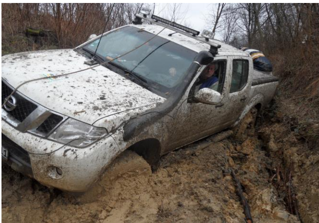
... Schlimmer geht's immer!!!

1. Tag: Individuelle Anreise der Teilnehmer zum Treff-Hotel direkt am Plattensee. Vor dem Begrüßungsdinner mit sicherlich vielen Erinnerungen und Bildern, Auslosung der Teams und Besprechung des Tropy Reglements. Vorbereitungen für die erste Etappe.