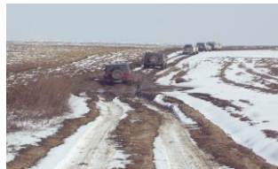
Bei Regen, Sonne oder Schnee...