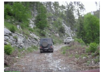
Steinige Pisten auf der Insel Cres und im Velebit

Abreisetag: Leider geht auch die schönste Tour viel zu schnell zu Ende. Wir verabschieden uns bis zum nächsten Mal. Von unserem Hotel ist es gar nicht mehr weit zur Autobahn Richtung Slowenien/Österreich/Italien/Deutschland.